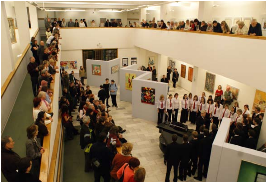
Vernisáž výstavy Náchodský výtvarný podzim.