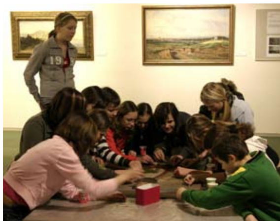
Interaktivní program k výstavě Obrazy a kresby ze sbírek GVUN restaurované v letech 2001–2007.

Účast: Programu, který se konal v dopoledních hodinách se zúčastnilo 160 dětí s doprovodem. Jednalo se zejména o žáky ze ZŠ