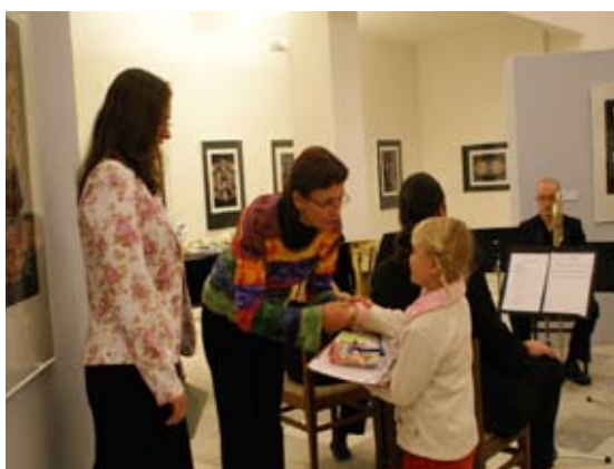
Předávání cen vítězům a vernisáž výstavy prací z výtvarné soutěže Naše Galerie.