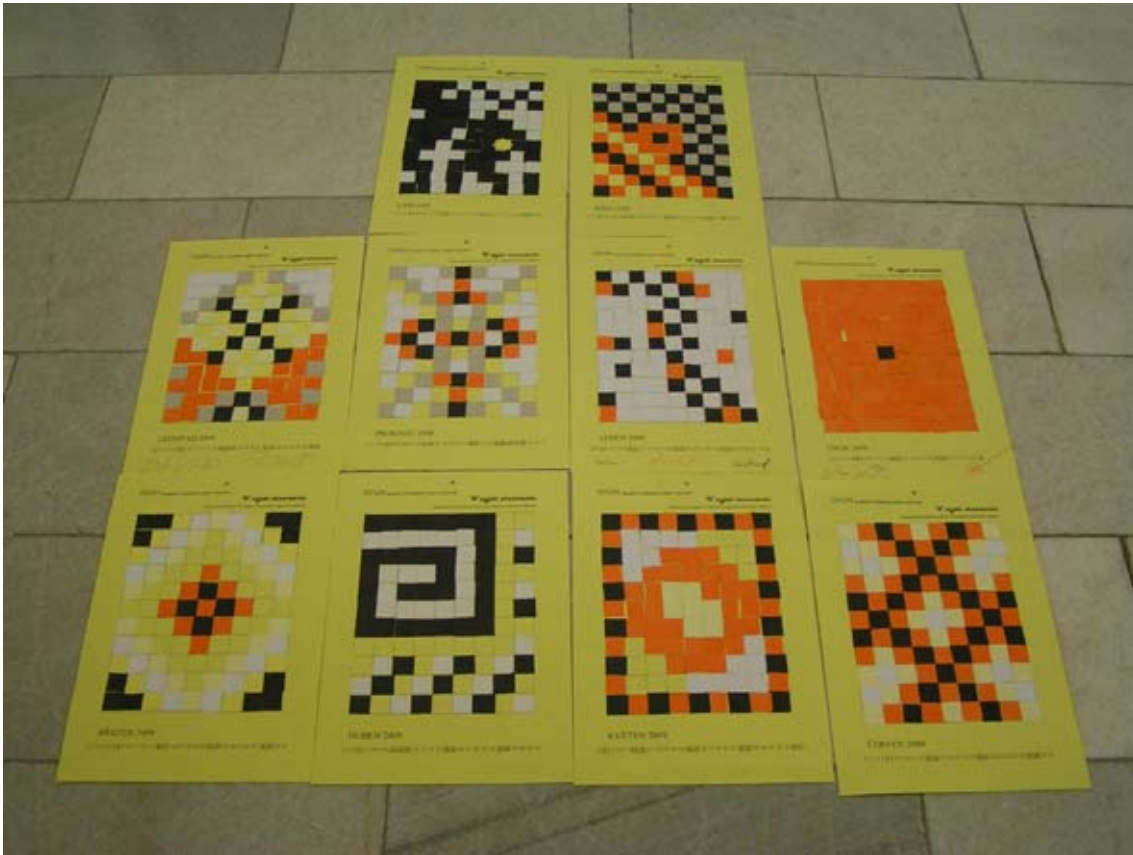
Interaktivní program V zajetí ornamentu při oslavách Dnů evropského kulturního dědictví 18. 9. 2008.

Náchod-Plhov (6. a 9. ročníky), dále pak děti ze ZŠ Velké Poříčí (3. až 5. třída) a z ZŠ Česká Skalice (7. třída).