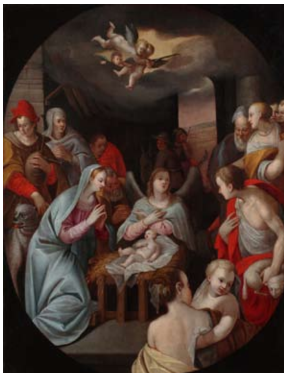
HCC (HCG ?), Klanění pastýřů , olej, plátno, 115,5 x 88,5 cm, přelom 16. a 17. století.