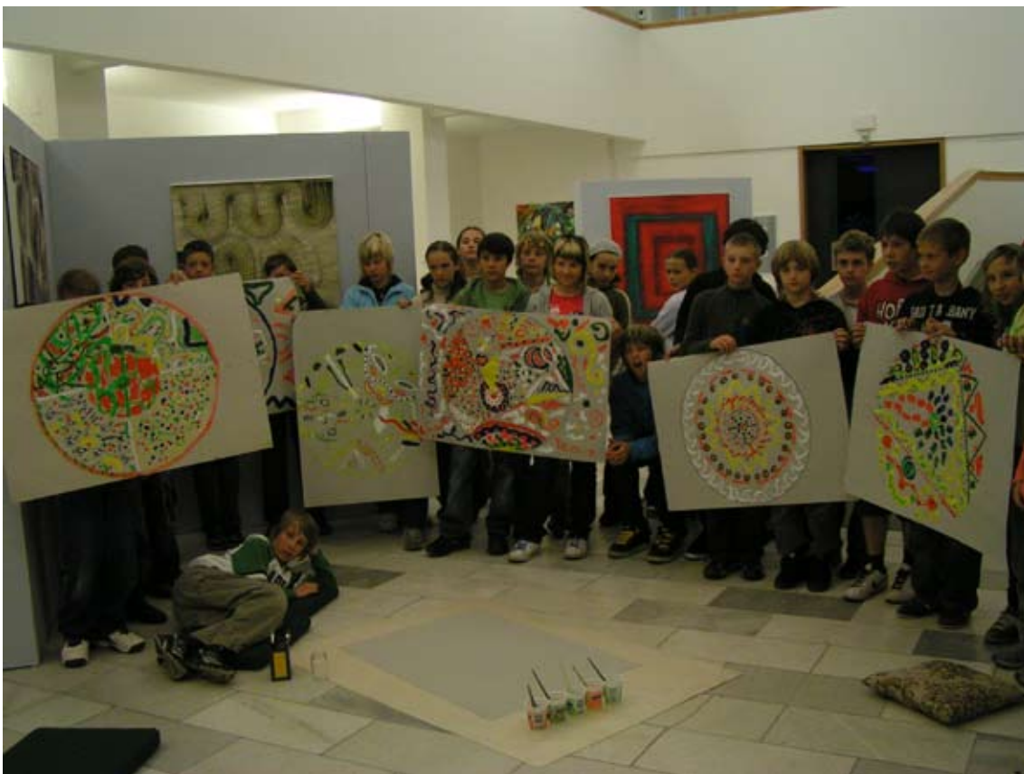
Interaktivní program Namaluj si svou vlastní mandalu při oslavě Mezinárodního dne muzeí a galerií 23. 5. 2008.