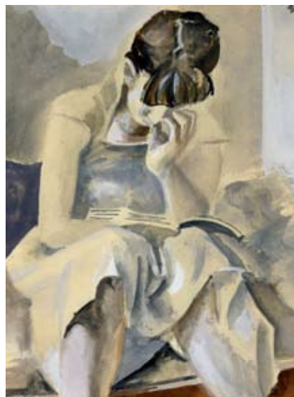
Andrej Bělocvětov, Čtenářka, kvaš, papír, 28,9 x 20,9 cm, 1953.

4. Oldřich Homoláč: Svlékající se dívka , olej, plátno, 70 x 70 cm, 1924, O 315.