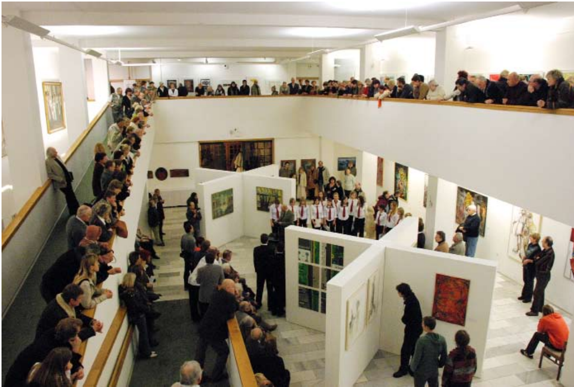
Vystoupení Sborečku na vernisáži Náchodského výtvarného podzimu.