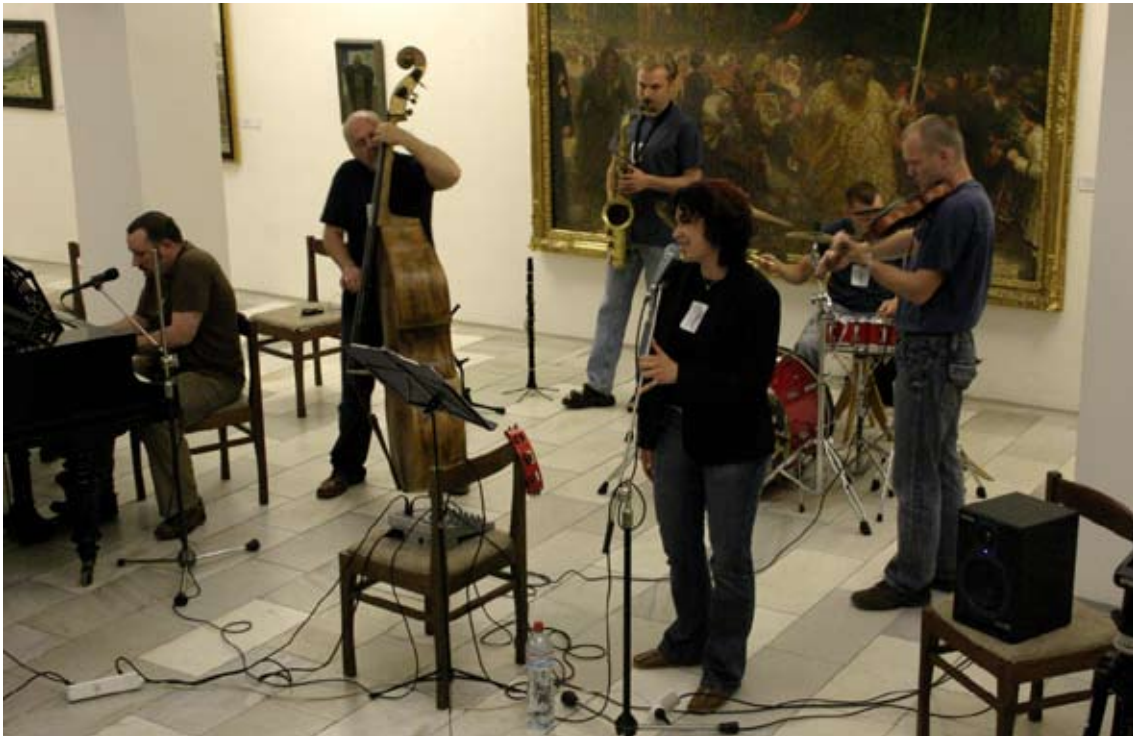
Mezinárodní den muzeí a galerií 25. 5. 2007 – šansonová skupina 6 NaChodníku.