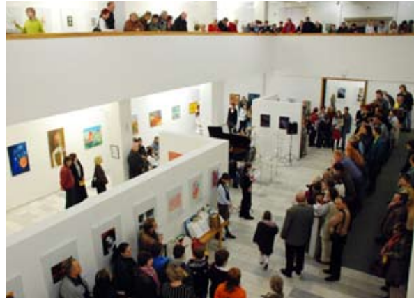
Předávání cen vítězům a vernisáž výstavy prací z výtvarné soutěže Naše Galerie.

V prostorách GVUN proběhlo celkem 8 výstav. Výstavy a doprovodné programy navštívilo celkem 5.894 osob.